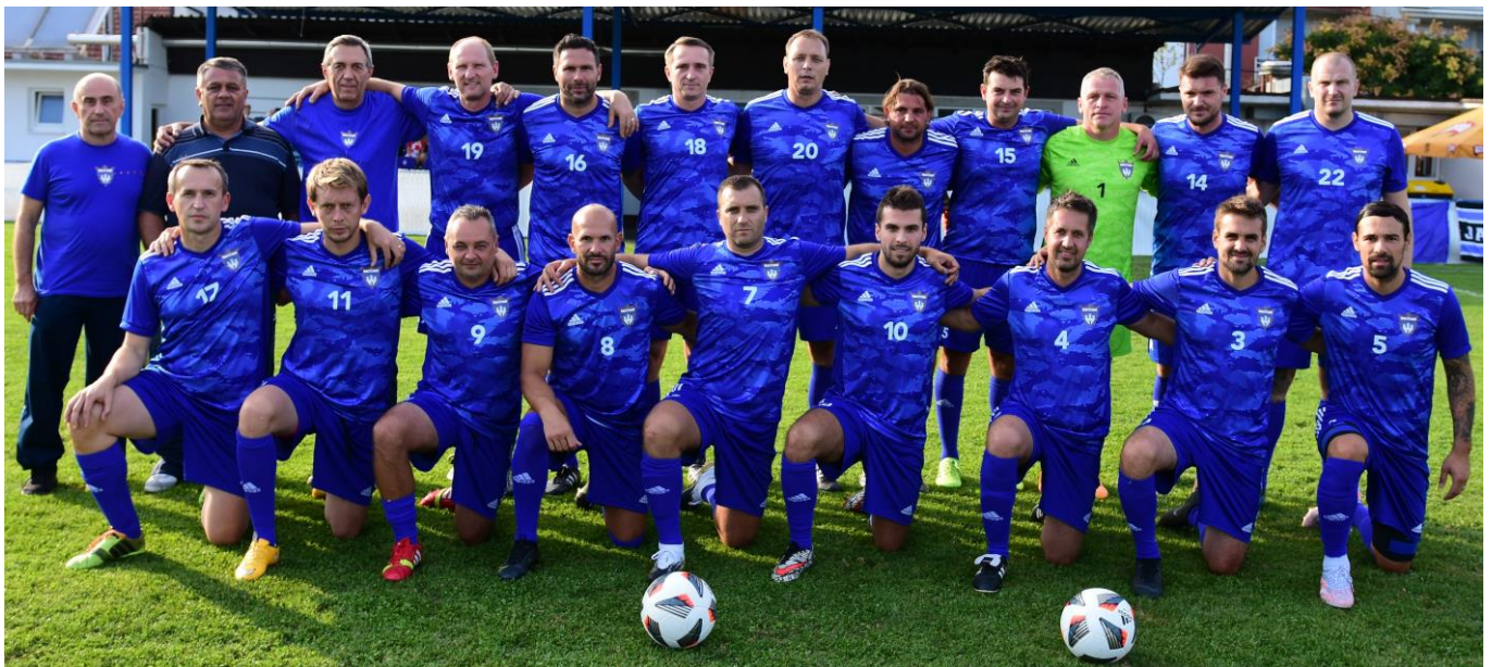
Reprezentacija veterana Zagrebačkog nogometnog saveza Zagreb, 4. rujna 2021. godine, igralište Nogometnog kluba Jarun

Poslije utakmice, domaćin Nogometni klub Jarun (Zagreb) je pripremio za sve sudionike utakmice i njihove goste, jela s roštilja i pića u velikim količinama. Druženje je proteklo uz nogometne razgovore, o bivšim i budućim vremenima. Na žalost, nije bilo previše vremena za druženje ( kao obično ) jer je u 20:45 h istoga dana igrala nogometna reprezentacija Hrvatske svoju kvalifikacijsku utakmicu u Slovačkoj koju smo svi željeli gledati.